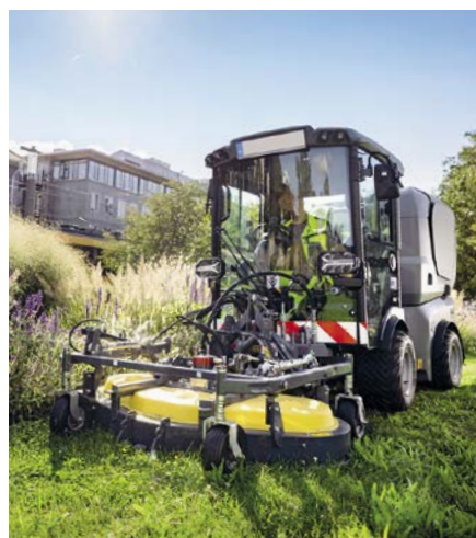
Bei Bedarf kann die MC 150 auch mit einem Mähwerk oder mit einer Frontkehrmaschine eingesetzt werden.

In puncto Motorisierung und Kehrtechnik ist die MC 150 ebenfalls sehr gut ausgestattet: Der 48 kW-Kubota-Motor sorgt für einen soliden Antrieb und kann bei Bedarf mit alternativen Kraftstoffen wie hydrierten Pflanzenölen (HVO) betrieben werden. Optional ist eine Differenzialsperre erhältlich. Das strömungsoptimierte Saugsystem liefert sehr gute Ergebnisse selbst bei niedriger Motordrehzahl und ist besonders kraftstoffsparend. Die Reinigungsleistung ist mit der nächsthöheren Zwei-Kubikmeter-Modellklasse vergleichbar. Um hohe Wirtschaftlichkeit und Flexibilität zu gewährleisten, können Anwender dank Schnellwechselsystem einfach zwischen verschiedenen Anbaugeräten wechseln, vom Kehren über das Mähen mit und ohne Aufnahme bis hin zu Winterdienst und Schwemmen. Die Motorverkleidungen lassen sich öffnen und bieten freien Zugang zum Motor – alle wartungsrelevanten Komponenten können schnell erreicht werden. (pr)