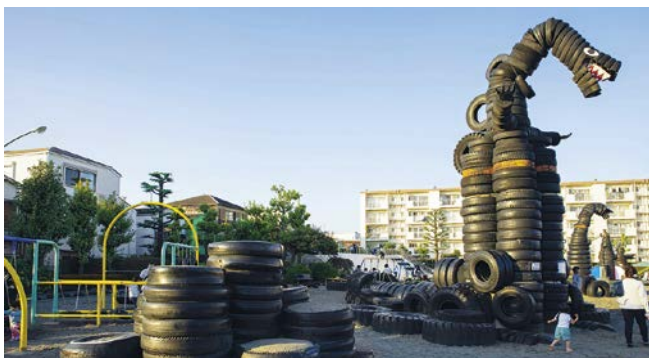
Teilen, Reparieren, Wiederverwenden wird Teil des Schulunterrichts.