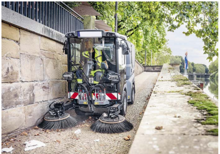
Die MC 150 ist eine neue, multifunktionale Kehrmaschine von Kärcher, die sich wie ein Geräteträger mit verschiedenen Anbaugeräten ausstatten lässt.

Ergonomie und Fahrkomfort sind in kompakten Kehrmaschinen zentrale Punkte, denn ein angenehmer Arbeitsplatz ist die Voraussetzung für Zufriedenheit und Gesundheit des Fahrers. Kärcher hat für die MC 150 eine aktive hydropneumatische Federung mit Einzelradaufhängung realisiert, die abhängig vom Fahrzeuggewicht reagiert. Somit ist der Federungskomfort unabhängig von der Beladung des Fahrzeugs gleichbleibend hoch. Bei Schlaglöchern und Bodenunebenheiten schaukelt das Fahrzeug ausserdem nicht auf und bietet somit hohen Fahrkomfort. Die Fahrgeschwindigkeit kann beibehalten und der nächste Einsatzort schneller erreicht werden. Die MC 150 wurde von unabhängigen Ärzten und Physiotherapeuten